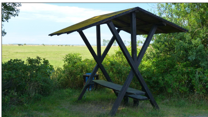
Picknickstation_Freesenort_2 - Inmitten von Grün lässt es sich herrlich entspannen

Entlang des gesamten Rad- und Wanderwegenetzes auf der Rügeninsel Ummanz finden Sie Picknickstationen - auch im malerischen Freesenort.