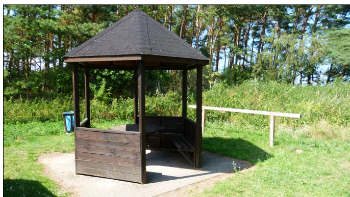
Picknickstation_Surfstation_2 - Eine überdachte und idyllisch gelegene Picknickstation

In der Nähe der Ummanzer Surfstation in Suhrendorf befindet sich eine überdachte Picknickstation, die während einer (Rad-)Wanderung zum Verweilen einlädt.