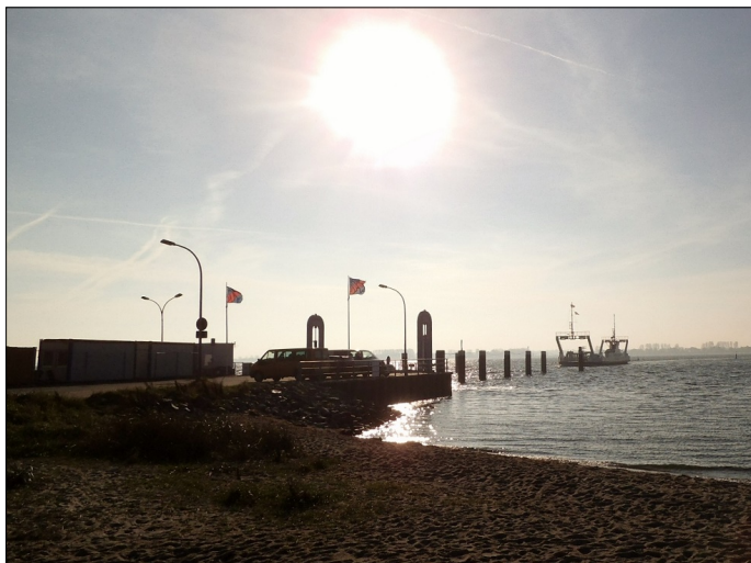
hs_Schaprode_Fährre - Glewitzer Fährre in Schaprode

Auf der Halbinsel Zudar, im Süden der Insel Rügen, liegt der Fährhafen Glewitzer Fährre, mit einer jahrhundertealten Fährverbindung zum Festland.